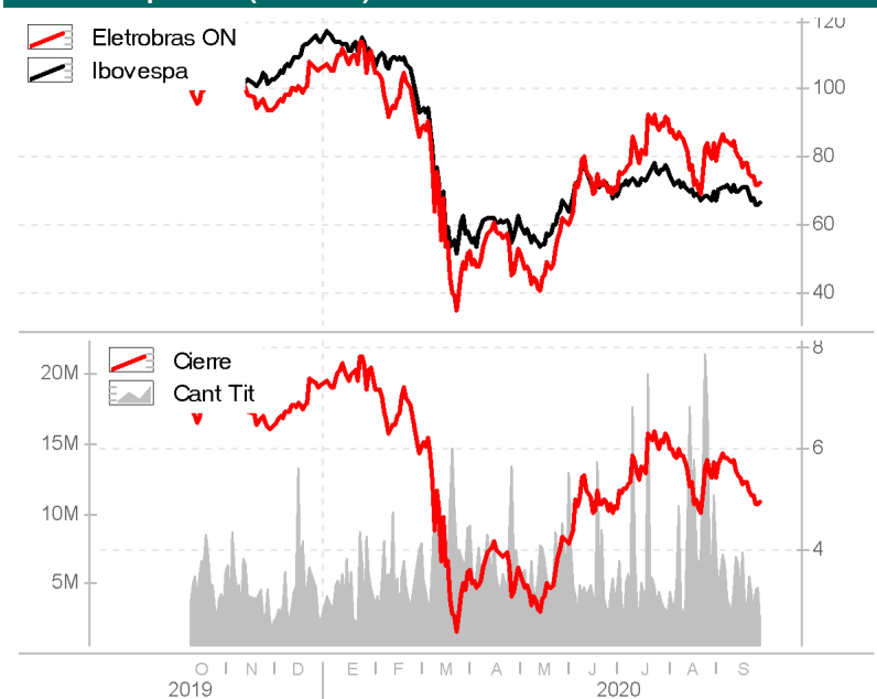
Gráfico de precios (252 días) - Euros